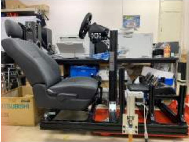
モックアップ作製